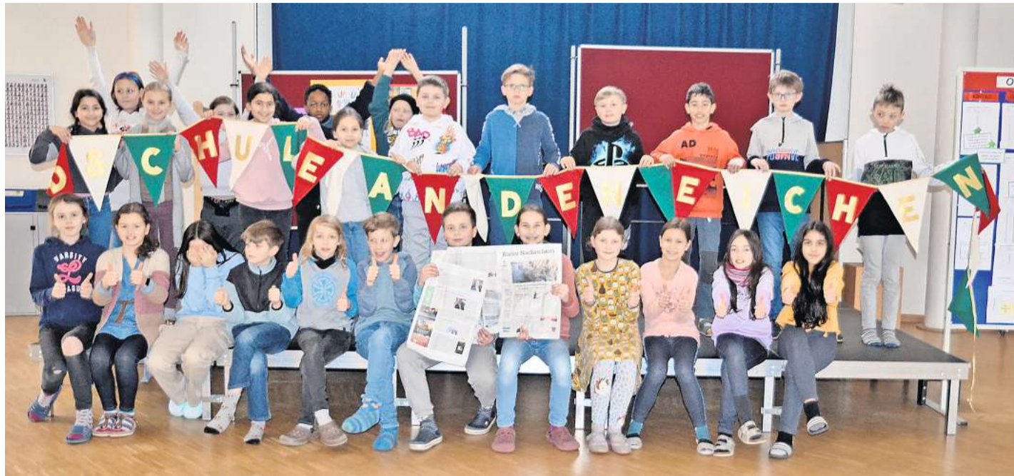
Ganz viel zu lesen: Auch die Klassen 4b und 4e der Grundschule An den Eichen in Kronshagen beteiligen sich am Medienprojekt MiSch der Kieler Nachrichten.